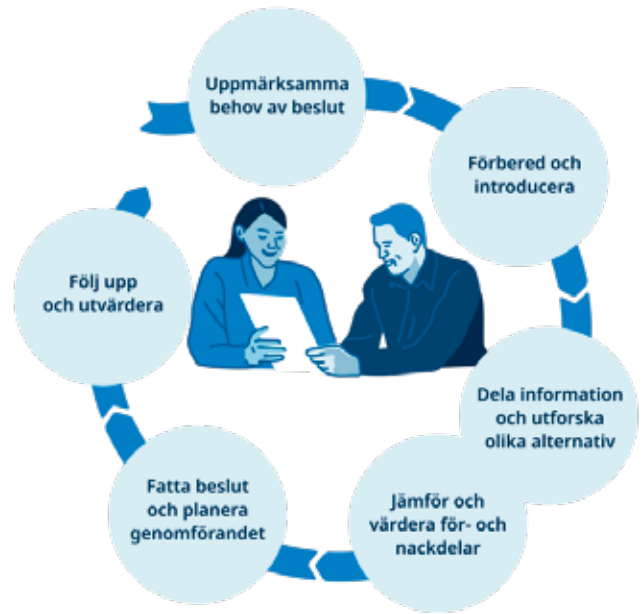
Bilden ovan visar de sex stegen i delat beslutsfattande.

Delat beslutsfattande är en central metod i en mer personcentrerad vård och omsorg vid olika psykiatriska tillstånd. Delat beslutsfattande (shared decision making) är en metod i sex steg där personer som behöver vård och stöd samarbetar med personalen för att fatta beslut om insatser. Metoden innebär ett kunskapsutbyte mellan de inblandade parterna, där personernas kunskaper och önskemål tas tillvara och värdesätts. Med hjälp av metoden kan person-