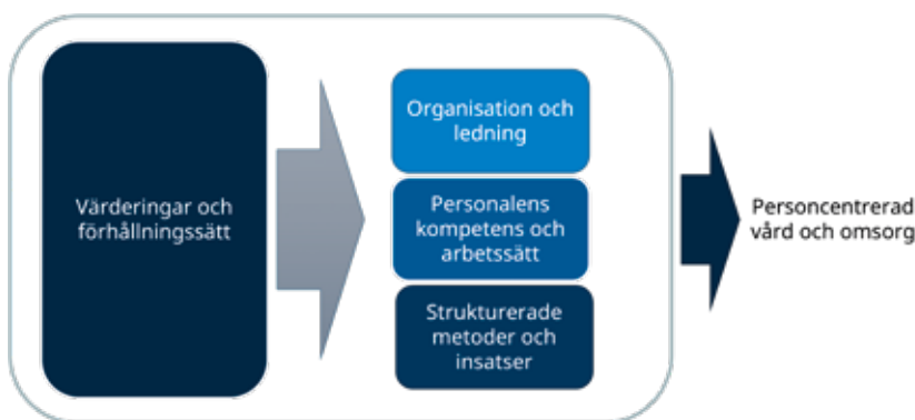
Visualisering av de delar som tillsammans bidrar till en personcentrerad vård och omsorg för personer med komplex psykiatrisk problematik.

Vi har tagit fram kunskapsstöd för att stödja implementeringen av metoden. Kunskapsstödet beskriver metoden och hur den kan användas i olika verksamheter. Filmer och stödmaterial finns att använda tillsammans med personen när metoden används och har tagits fram för att stödja verksamheter följa rekommendationen. Med hjälp av broschyren Så här kan du vara med och fatta beslut kan personen själv, närstående och personal förbereda och samtala om beslut som ska fattas, olika alternativ som finns och för- och nackdelar. En del av metoden är även att få information om vilka olika alternativ som finns på ett sätt som är lätt att ta till sig. I broschyren Guide till stöd och hjälp beskrivs olika sorters stöd i vardagen som personen själv och närstående kan efterfråga.