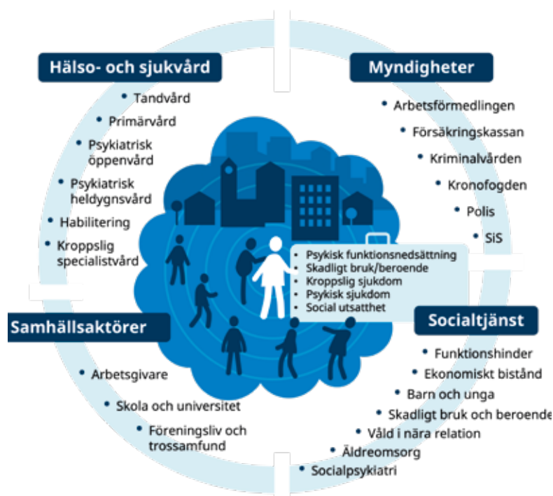
Visualisering av komplexitet i välfärdssystemet för personer med psykisk funktionsnedsättning och stora behov.

Personer med psykiatriska tillstånd och stora behov får inte alltid de insatser de behöver för att må bättre och öka sin livskvalitet. Det beror bland annat på vårdens och omsorgens komplexa system och brist på samordning. Men också på att kunskap kan saknas hos personal och att deras förutsättningar att ge en personcentrerad vård och omsorg varierar. Socialstyrelsen har sedan 2022 haft ett uppdrag av regeringen att stärka och utveckla personcentrerade insatser för personer med så kallad komplex psykiatrisk problematik. Uppdraget avslutas i september 2025.