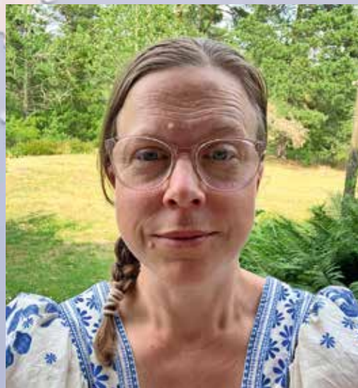
Alinda Blomkvist.